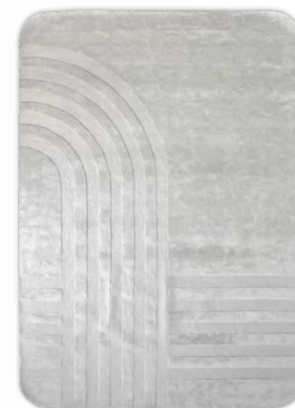
SATORI tapis/rug design Alessandra Benigno L 200 x H 300 cm L 250 x H 350 cm