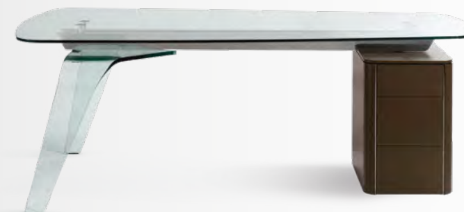
AGAPE bureau/desk design Sacha Lakic L 210 x H 75 x P/D 93 cm

Composition présentée/composition displayed : L 346 x H 300 x P/D 47 cm