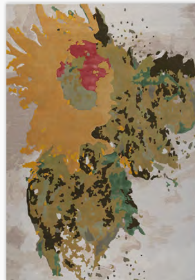
SUNFLOWER tapis/rug L 200 x H 300 cm / L 250 x H 350 cm