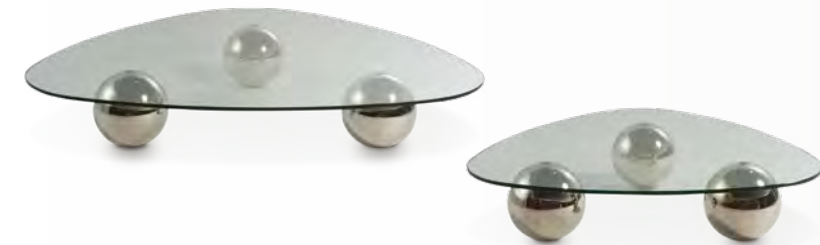
SUMITO tables basse/cocktail table design Christian Ghion

Première collaboration entre Christian Ghion et la marque, la très seventies table basse Sumito a un plateau en verre - un triangle bombé - qui repose sur trois billes d'acier chromées. L'aérien luminaire Autographe, quant à lui, est pensé comme la trace lumineuse d'un geste dans l'espace.