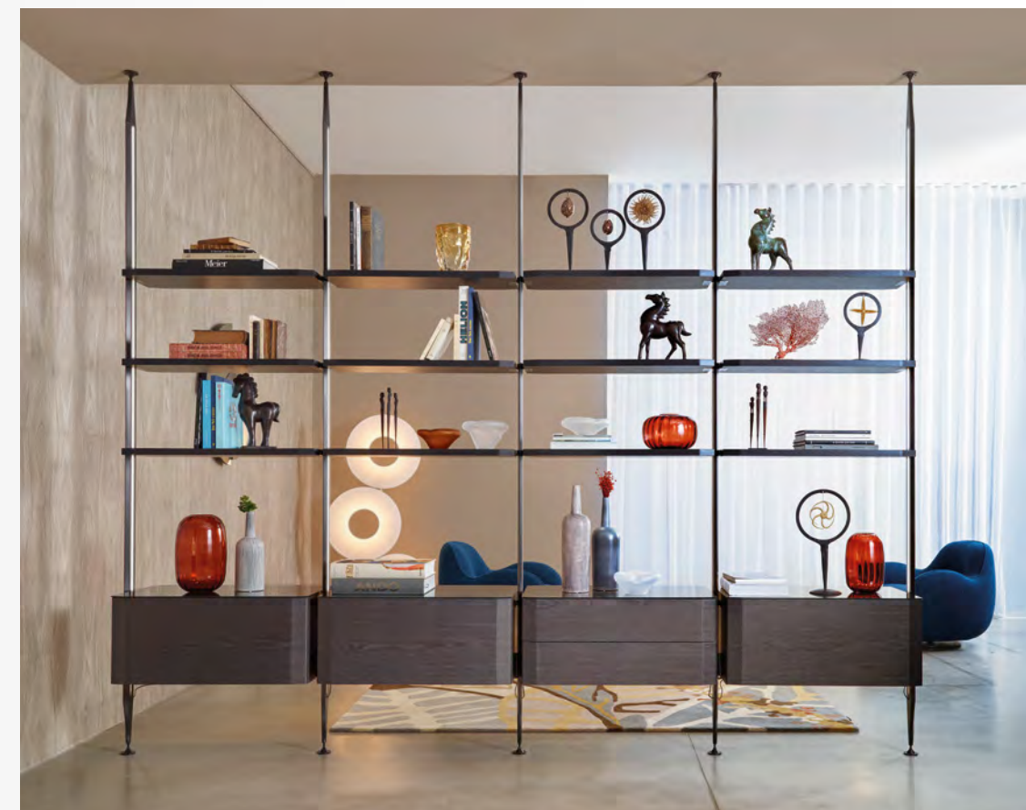
CLIFFHANGER bibliothèque/bookcase design Studio Roche Bobois

Composition présentée/composition displayed : L 346 x H 300 x P/D 47 cm