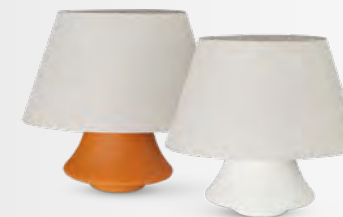
FLAMENGO lampe/table lamp design Bruno Moinard L 64 x H 57 x P/D 40 cm