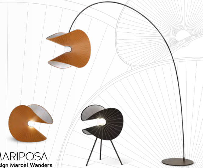
MARIPOSA design Marcel Wanders Lampe mini/mini table lamp L 27 x H 40 x P/D 27 cm Lampe/table lamp L 55 x H 48 x P/D 44 cm Lampadaire/floor lamp L 55 x H 210 x P/D 55 cm