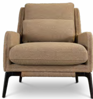
MADISON fauteuil/armchair design Pierre Dubois & Aimé Cécil L 72 x H 78 x P/D 79 cm