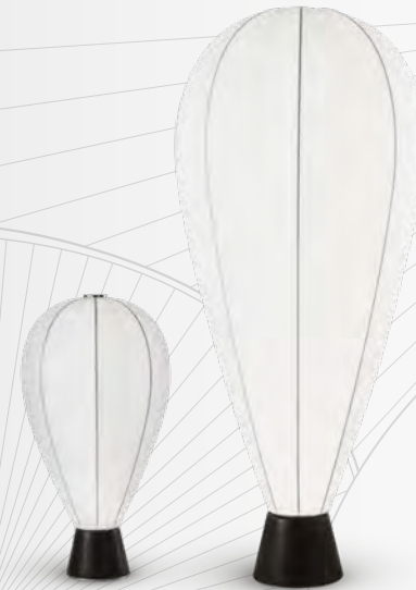
UP lampe/lamp design Marcel Wanders L 80 x H 180 x P/D 80 cm L 50 x H 100 x P/D 50 cm L 33 x H 60 x P/D 33 cm