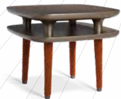
LA PARISIENNE design Marcel Wanders Chevet/bedside table : L 54 x H 46 x P/D 54 cm