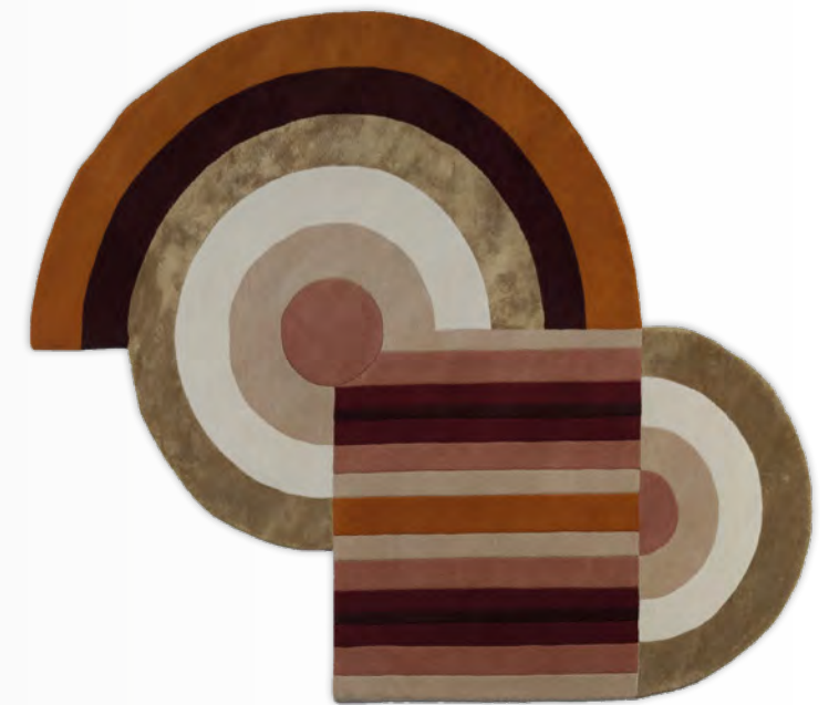
RING tapis/rug design Géraldine Prieur L250 x H350 cm L200 x H300 cm