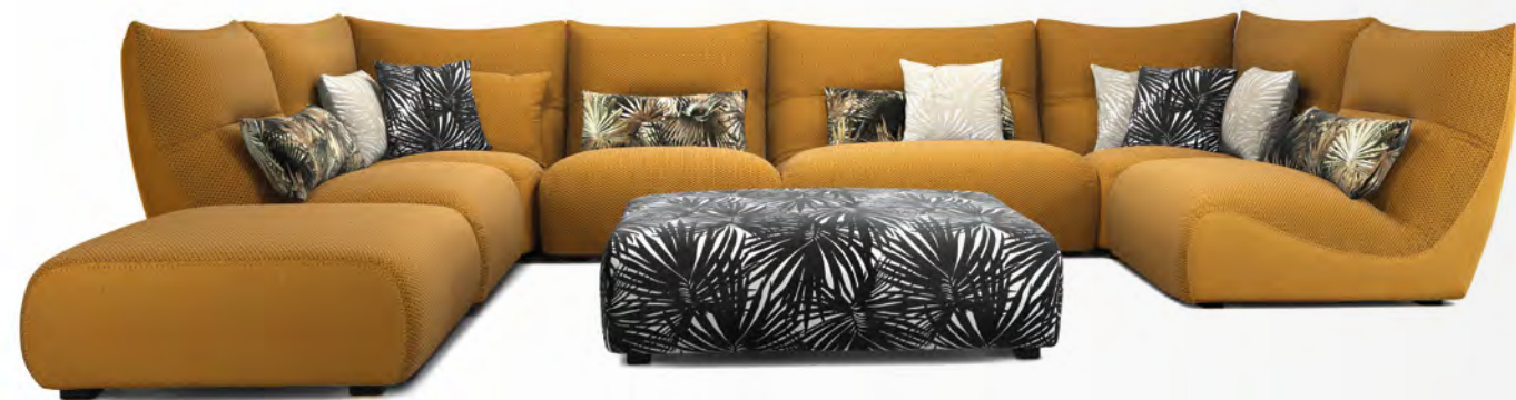
TEMPS CALME OUTDOOR canapé modulaire/modular sofa design Studio Roche Bobois

Vrai frère jumeau du modèle originellement conçu pour l'intérieur, cet ensemble modulaire et convivial, au confort maximal, arbore ici une livrée aux couleurs chaudes et inattendues.