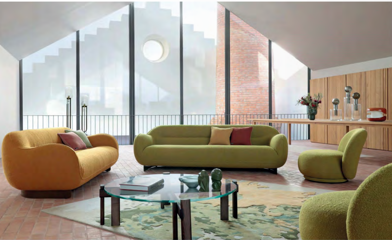
CADENCE canapé/sofa design Maurizio Manzoni L 240x H 72x P/D 100cm L 220x H 72x P/D 100cm