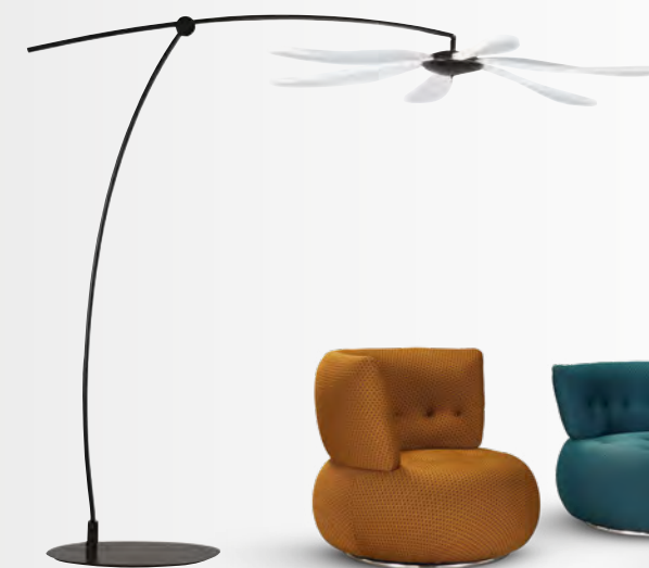
LIBELLULE lampadaire/floor lamp design Studio Messieurs

Table basse/cocktail table : L 77 x H 39 x Ø 77 cm Bout de canapé/end table : L 56 x H 43 x Ø 56 cm Desserte/occasional table : L 45 x H 55 x Ø 45 cm