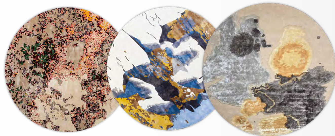
BOTANICA - SHINCHUU tapis/rug design Emmanuel Thibault Ø 280 cm