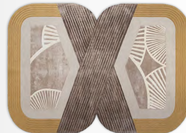
SUSHI tapis/rug design Messieurs L 200 x H 300 cm / L 250 x H 350 cm