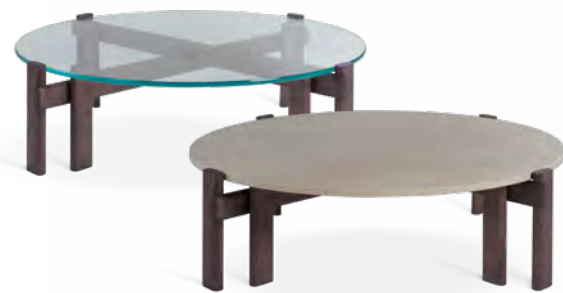
PARIS PANAME table basse/cocktail table design Bruno Moinard Plateau verre ou marbre/glass or marble top Ø 117 x H 32 cm