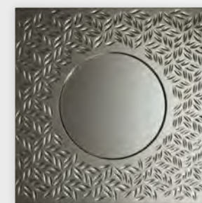
FEELING miroir/mirror design Alessio Bassan L 110 x H 110 cm

Grained, engraved, incised, rippled and coloured... Annealed glass undergoes a host of experiments to achieve greater texture. Blue is the perfect shade for summer!