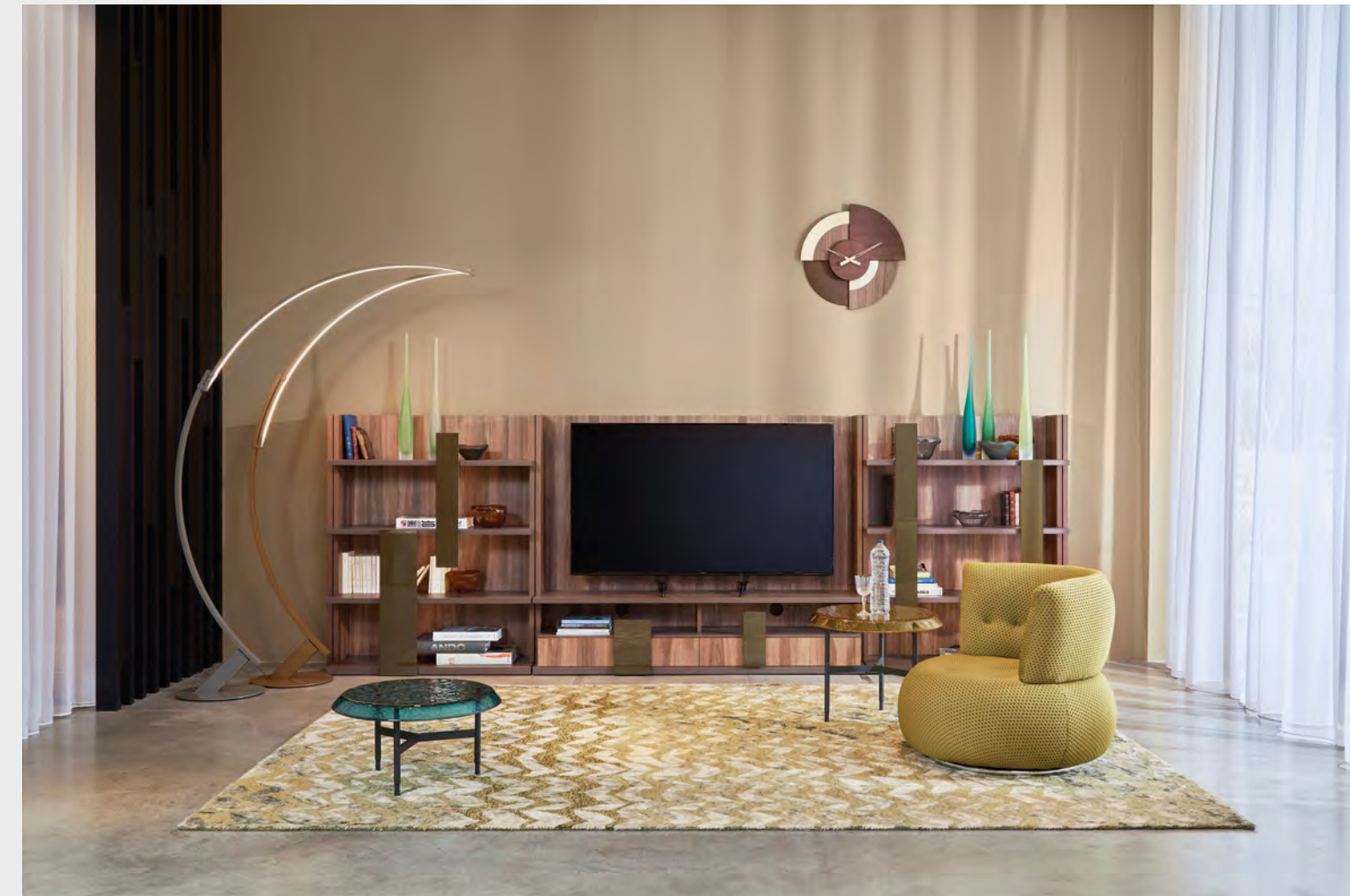
TOCCATA bibliothèque/bookcase design Alessio Bassan L 407 x H 141 x P/D 42.5 cm

With this exceptional piece, design takes on a new, sculptural dimension where strength meets fluidity.