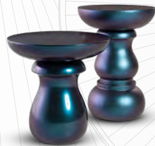
CHESS design Marcel Wanders Bout de canapé/end table : H 50 x Ø 50 cm Desserte/occasional table : H 44 x Ø 60 cm