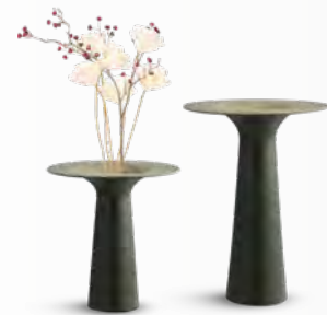
CHET vase design Luca Binaglia L 32 x H 33 x Ø 32 cm L 32 x H 45 x Ø 32 cm