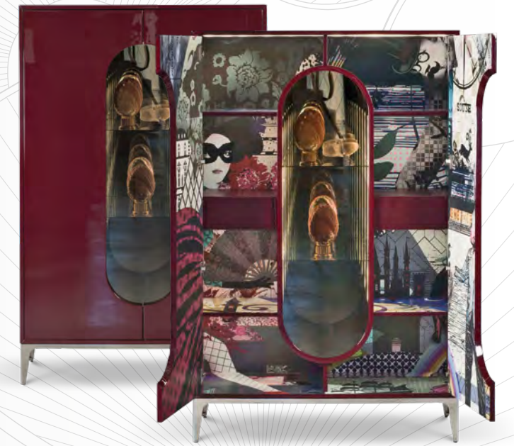
WONDER DRESSING armoire/wardrobe design Marcel Wanders L 120 x H 185 x P/D 50 cm