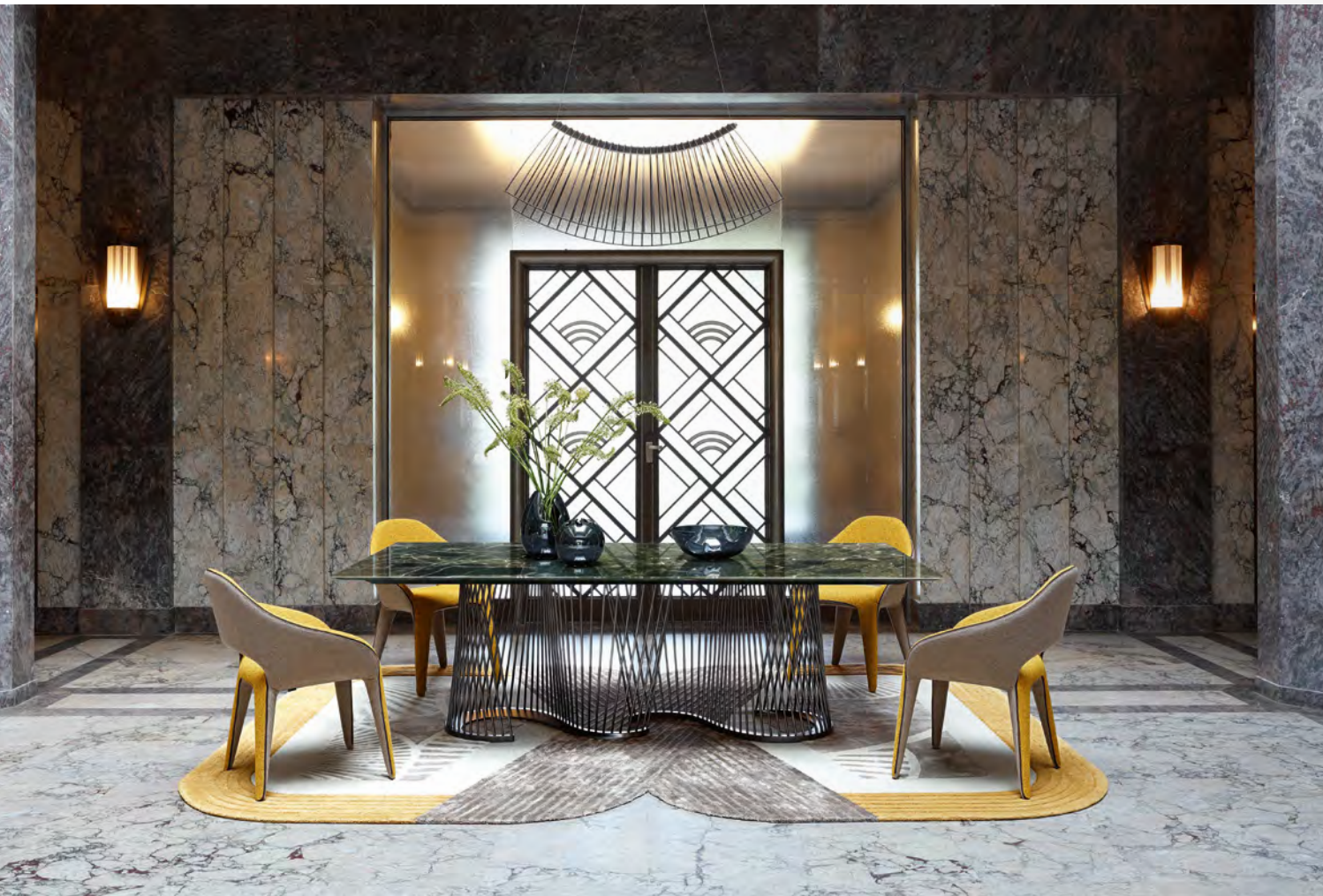
SERPENTINE table de repas/dining table design Fabrice Berrux

Avec cette pièce d'exception, le design explore de nouvelles figures à la dimension sculpturale, où se mêlent puissance et fluidité.