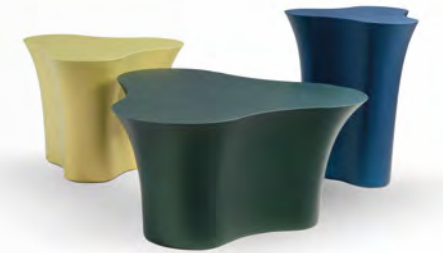
TRIOLET design Julie Figueroa Zafiro

Les pièces de ce trio possèdent une forme trilobée évoquant un tronc d'arbre renversé. Elles viennent dans un choix d'incroyables teintes irisées mimant les couleurs changeantes des scarabées.