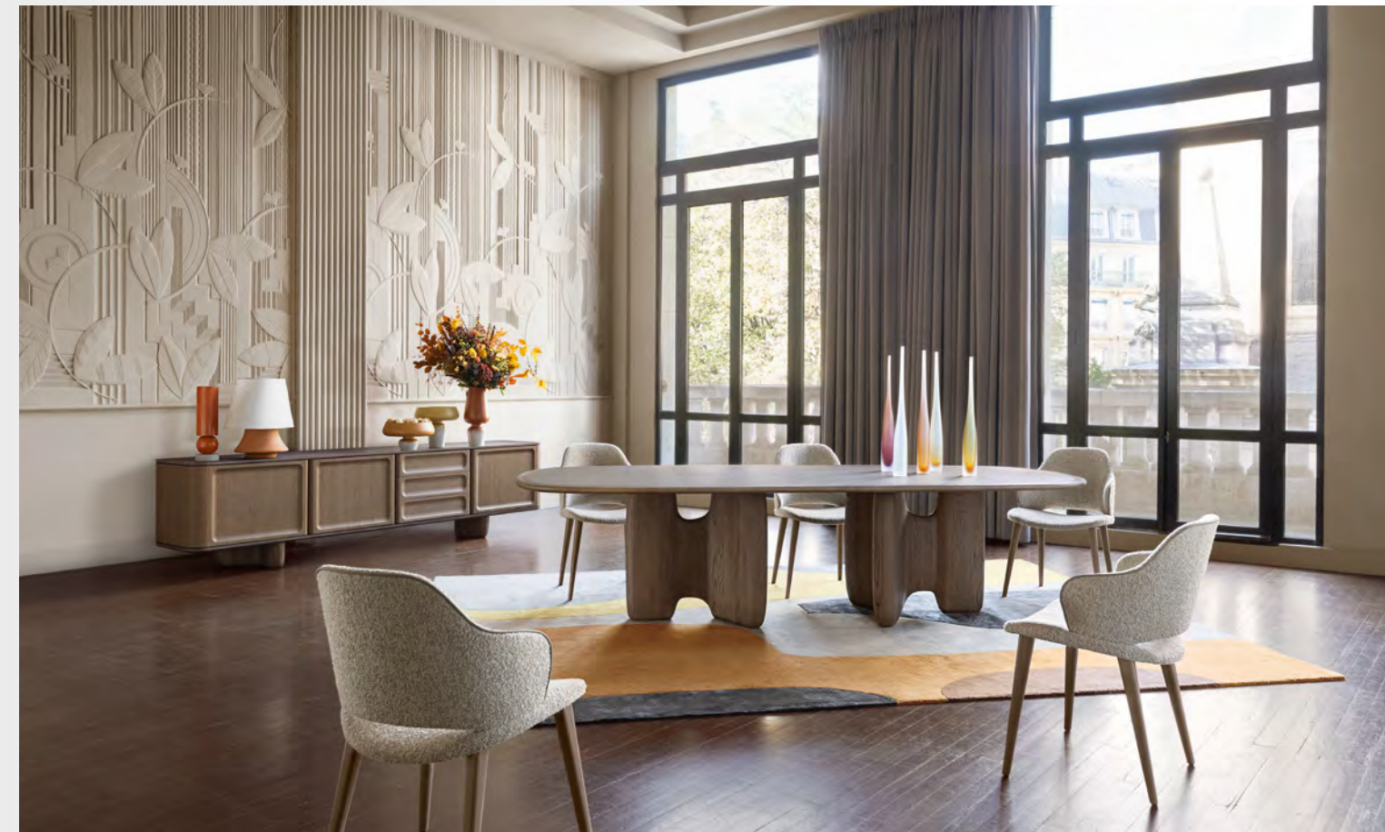
RIO IPANEMA table de repas/dining table design Bruno Moinard Table de repas/dining table : L 200x H 76.3 x P/D 130 cm Buffet/sideboard : L 300x H 74 x P/D 55 cm

The combination of sensual materials and soothing curves is heightened by the soft, irregular bouclette of a rounded sofa, the brushed oak top of a stately table with organic lines, and the unparalleled depth of a floral rug.