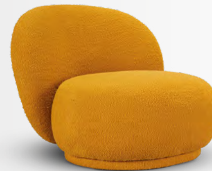
AROBASE fauteuil/armchair design Antoine Fritsch & Vivien Durisotti L89 x H71 x P/D86 cm