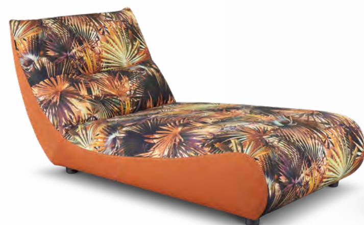
Chaise longue/Lounge chair L87 x H76 x P/D156 cm

Twinning with the model originally designed for indoors, this buoyant, modular and truly comfortable set displays warm, unexpected colours in the outdoor version.