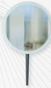
GLOBETROTTER design Marcel Wanders Miroir/mirror Ø 30cm - manche/handle 10,6 cm