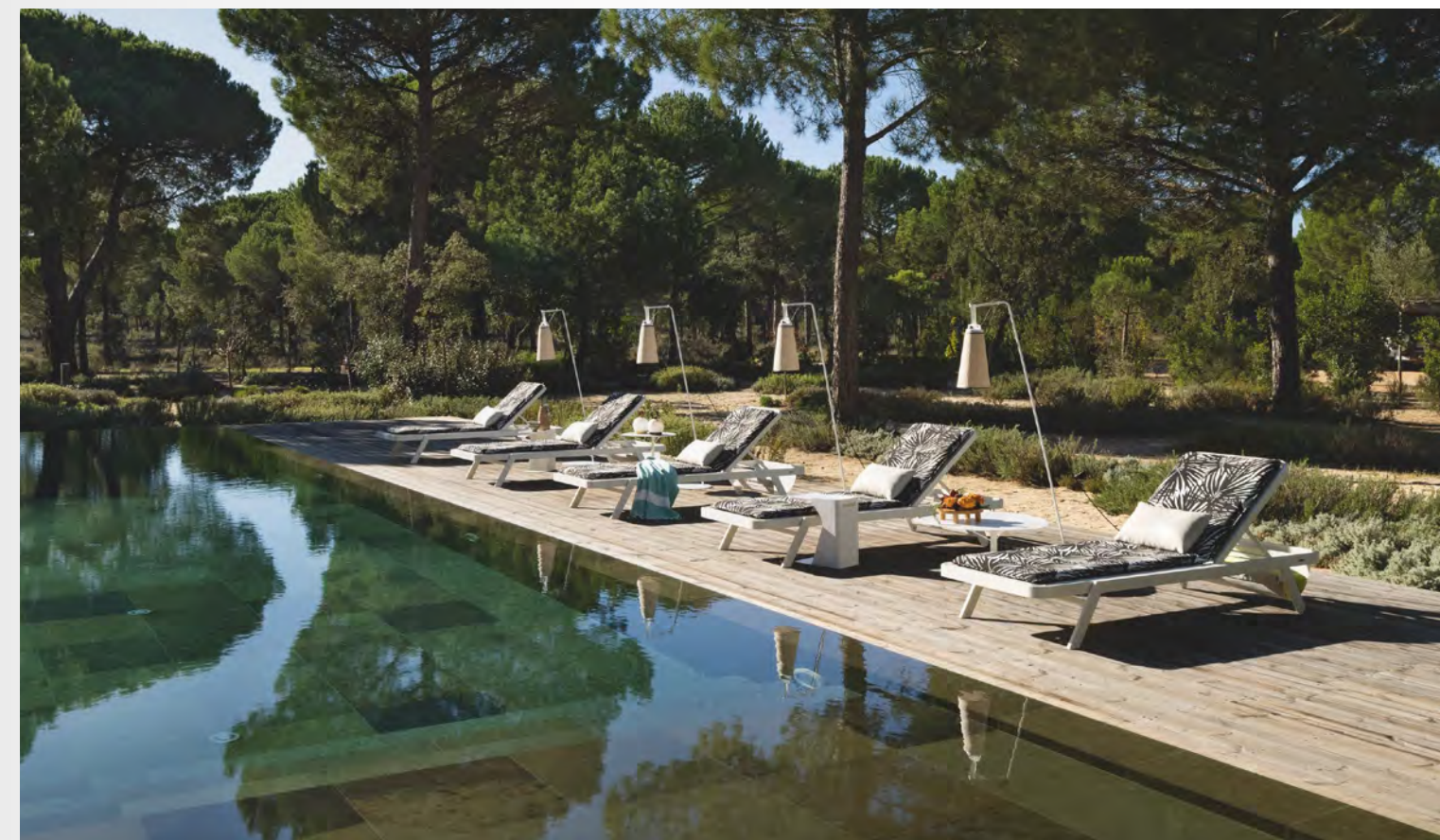
SUNSET chaise longue/lounge chair design David Rockwell L210 x H32 x P/D81 cm