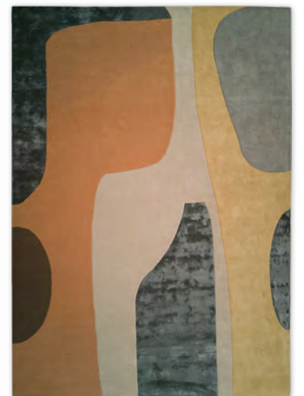
ORELIA tapis/rug L 200 x H 300 cm L 250 x H 350 cm L 300 x H 400 cm