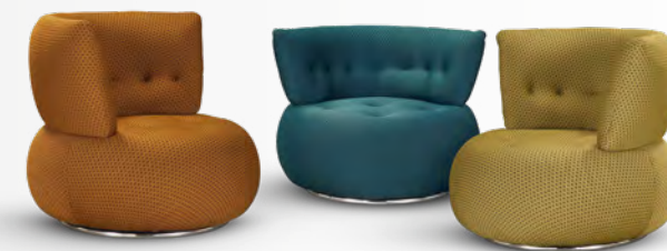
SENSE fauteuil pivotant/pivoting armchair design Studio Roche Bobois

Haut dossier/high back : L 83 x H 76 x P/D 79 cm Bas dossier/low back : L 83 x H 68 x P/D 79 cm