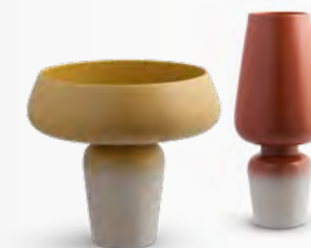
KURBA vase design Jean-Christophe Clair L 35 x H 35 x Ø 35 cm L 21 x H 49 x Ø 21 cm