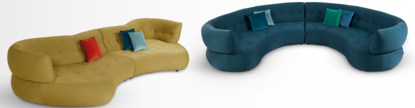
SENSE canapé/sofa design Studio Roche Bobois TILLEUL : L 359/149 x H 75 cm FORÊT : L 343/215 x H 75 cm

The animal, plant and mineral kingdoms inspire poetic designs with magnified proportions, organic shapes and amplified natural motifs.