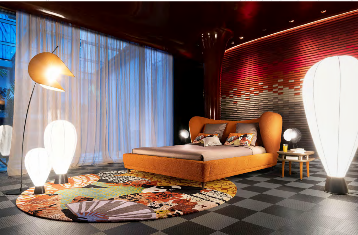
MONTGOLFIÈRE lit/bed design Marcel Wanders L 230 x H 125 x P/D 255 cm (pour une literie de 180 x 200 cm/for a 180 x 200 cm bed)

Construite autour d'une fresque artistique inspirationnelle désormais recolorée dans des tonalités chaleureuses, elle voyage aujourd'hui dans l'univers de la chambre. Autour du théâtral lit Montgolfière aux allures de love-bed, gravite une pléiade de nouvelles propositions : banc de lit, chevets, Wonder Dressing, luminaires, miroirs et le fauteuil Tribal pour l'Outdoor (cf. page 21).