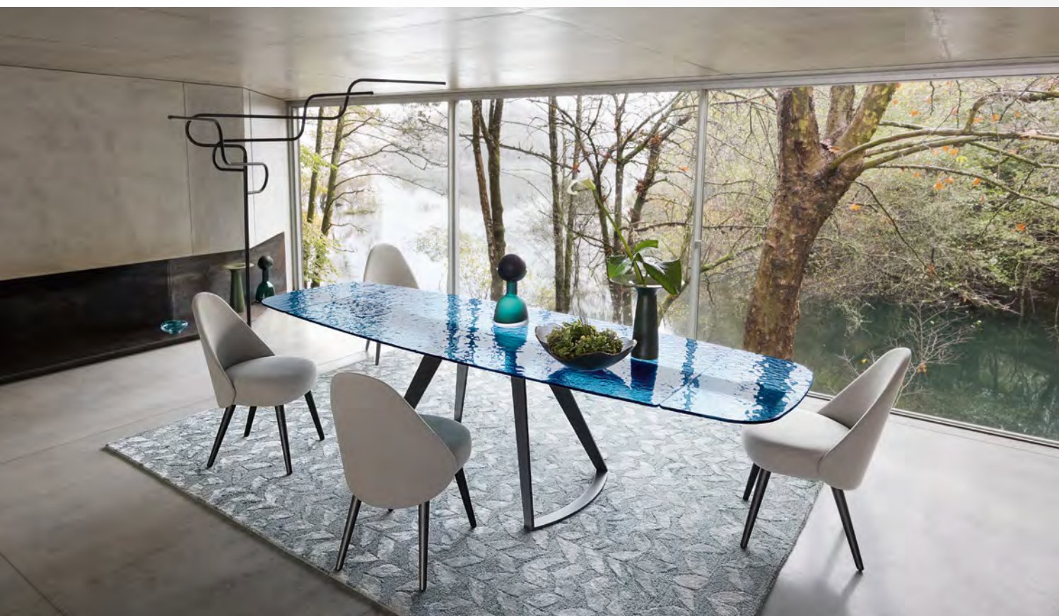
IROISE table de repas/dining table design Studio Roche Bobois

Grainé, gravé, incisé, strié et coloré... dans une recherche de rendus plus texturés, le verre, recuit, se plie à beaucoup d'expérimentations. L'été, le bleu lui va si bien !