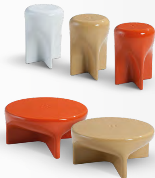
ROCKET OUTDOOR design Nathanaël Désormeaux & Damien Carrette Table basse/cocktail table: H35 x Ø80 cm Desserte/occasional table: H47 x Ø32 cm