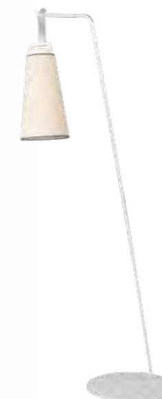
SASHA lampadaire/floor lamp design Studio Nathrang H174 x Ø42 cm