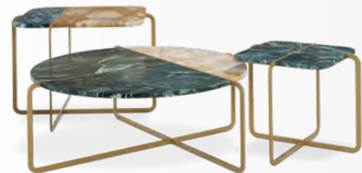
DOLOMIE design R&D Monitillo1980

L 220 x H 75 x P/D 120 cm L 240 x H 75 x P/D 120 cm L 260 x H 75 x P/D 120 cm