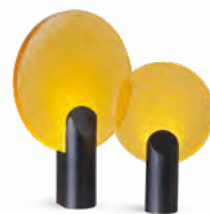
RISE lampe/table lamp design Jonathan Radetz

Avec 2 allonges de 40 cm/with 2 x 40 cm extensions : L 180/260 x H 75 x P/D 100 cm et/and L 220/300 x H 75 x P/D 100 ou/ or 110 cm