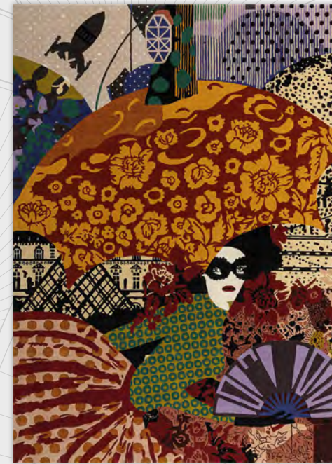
PARIS NEW WAVE tapis/rug design Marcel Wanders Ø 300 cm L 200 x H 300 cm L 250 x H 350 cm

Based on an inspirational fresco revisited in warm colours, the collection now travels into the bedroom. The theatrical Montgolfière "love bed" sits at the centre of a host of new pieces: end-of-bed ottoman, bedside tables, Wonder wardrobe, lamps and mirrors and the outdoor Tribal armchair (see page 21).