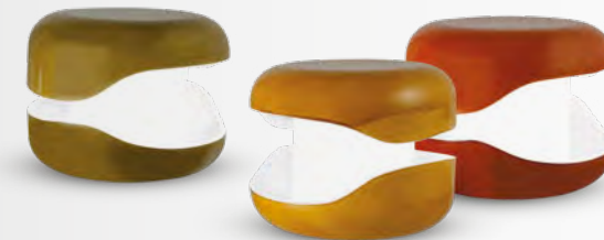
FRAGMENT lampe/table lamp design Aurélie Richard L30 x Ø30 cm