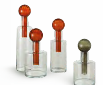
BASEL vase design Pierre Dubois & Aimé Cécil H 70 x Ø 17 cm H 55 x Ø 17 cm H 45 x Ø 22 cm