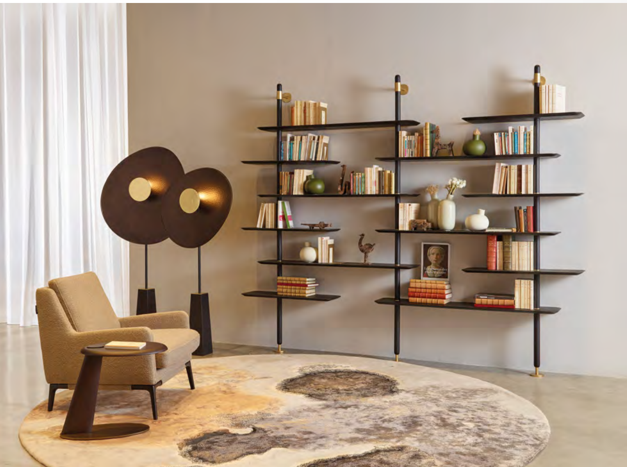
KETCH bibliothèque/bookcase design Andres Martinez L 260 x H 232 x P/D 30 cm

Verre et métal, bois et métal, marbre et métal. Ces dialogues de matières confèrent une expression particulière à ces nouvelles pièces qui, si elles s'ancrent dans les tendances actuelles, peuvent devenir des classiques de demain.