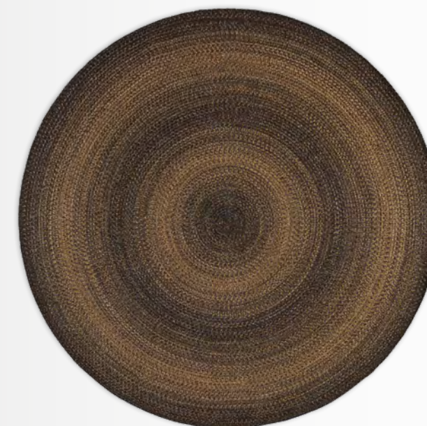
TRESSE tapis/rug Ø250 cm