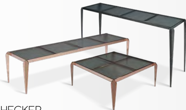
CHECKER design Fabrice Berrux

Comme un damier, Checker est un ensemble de tables basses, console et bouts de canapé dont les plateaux alternent des carreaux de verre strié. Ils reposent sur une gracieuse structure métal qui s'affirme en débordant du cadre.