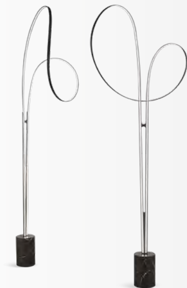
AUTOGRAPHE lampadaire/floor lamp design Christian Ghion L75 x H200 x P/D50 cm

L151 x H26.5 x P/D147 cm L113 x H26.5 x P/D110 cm